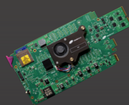
UHD 3901-UC HDR conversão HDR-SDR/SDR-HDR conversão cruzada HD/4K