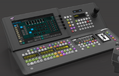
K-Frame Series com QUALQUER painel (Korona/Karrera/Kayenne)