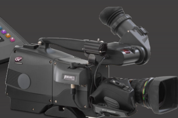
QUALQUER Câmera LDX Series em HD e 4K UHD (LDX 82/LDX C82 e superiores)