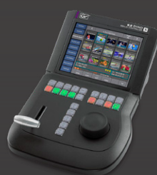
Sistema de Replay K2 Dyno